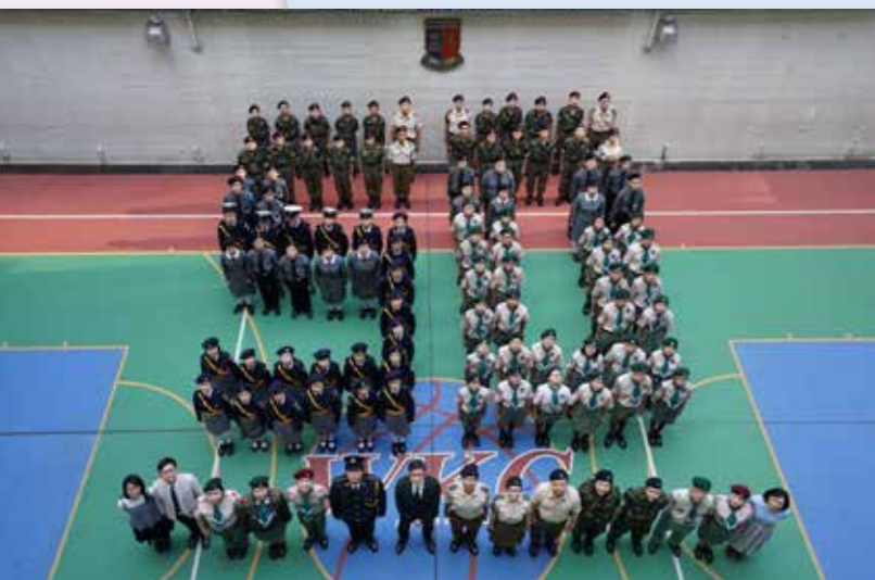
惠僑邁向金禧五十載

開放日當天，本校更邀得教育局副局長蔡若蓮女士、中聯辦副部長劉建豐博士作主禮嘉賓，而各方友好、多間姊妹校、多屆舊生，以及坊眾們均大駕光臨，同賀惠僑這個別具意義的里程碑。