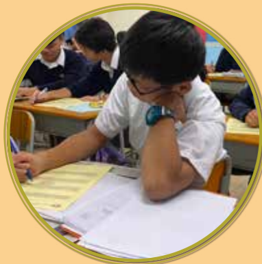
認真地反思自己性格的不同特質

為加強同學的生涯規劃意識，惠僑定期為學生提供相關課程。透過不同活動，協助同學認識自己的性格特質、興趣與能力，回顧個人重要經歷，所謂「知人者智，自知者明。」自我認識，方能發掘自己在升學及擇業上的方向。