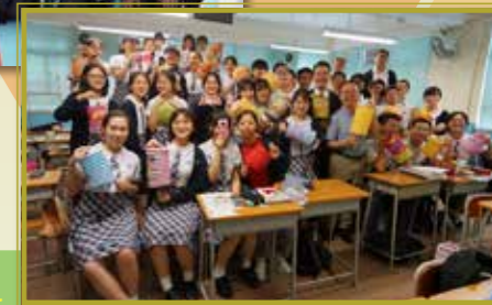
但願人長久，人月兩團圓