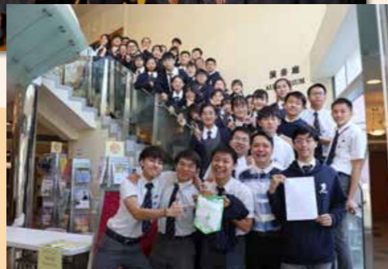
繼承師兄師姐的優秀傳統，讓惠僑四度蟬聯冠軍