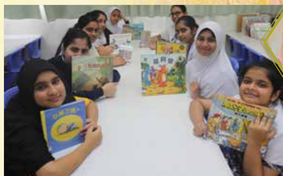
勇奪「全港非華語學生中文講故事比賽」初中組冠軍及季軍