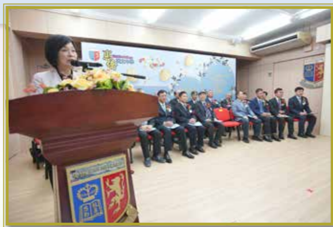
開幕典禮主禮嘉賓 教育局副局長蔡若蓮女士致詞