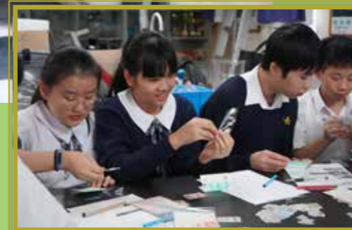
做個漂亮的名牌代表自己