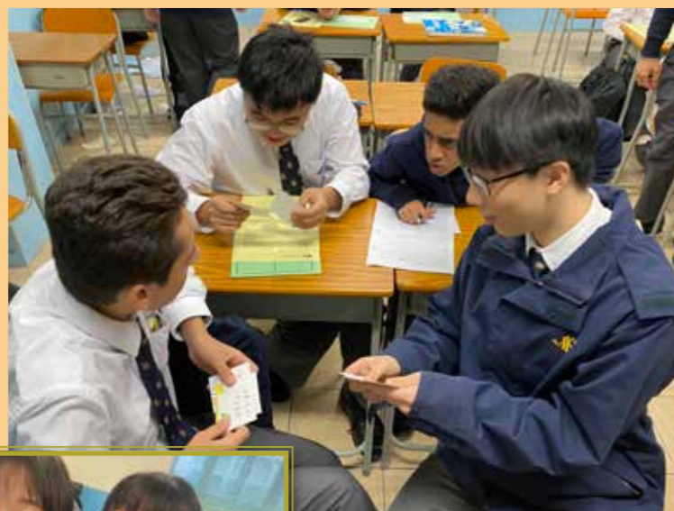
我們都在「尋找」自己