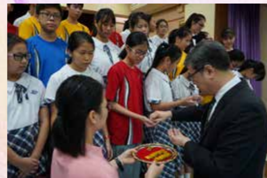
校長頒發襟章予每一位閱讀大使