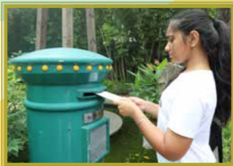
寫下「十年之約」，期待將來拆閱