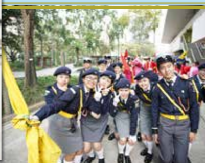
建立了深厚的感情