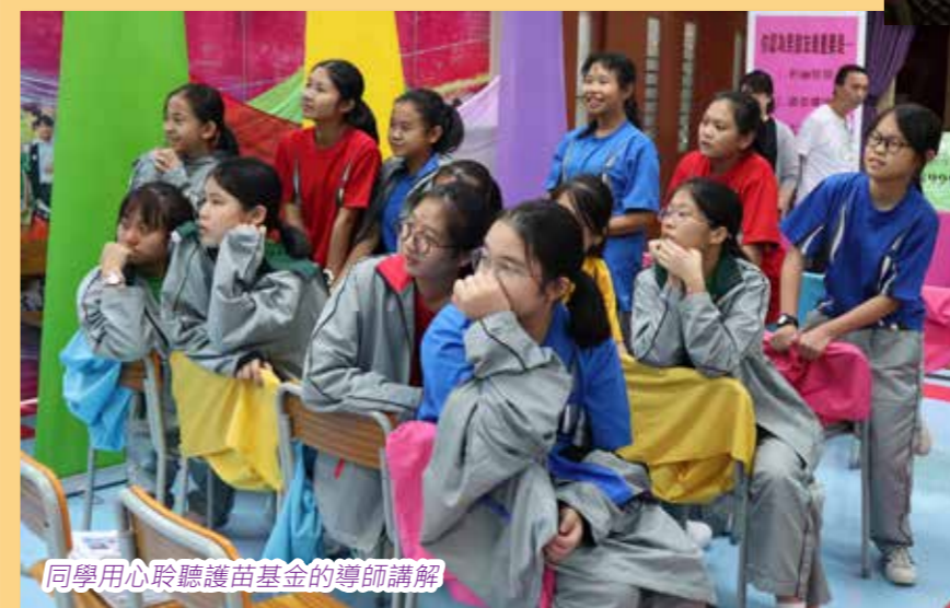
同學用心聆聽護苗基金的導師講解