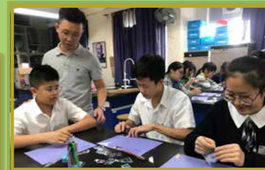
用貼紙和文字記錄下我所認識的香港