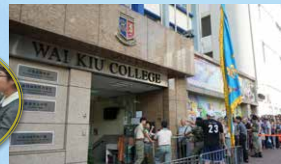
維持秩序讓長者進入禮堂