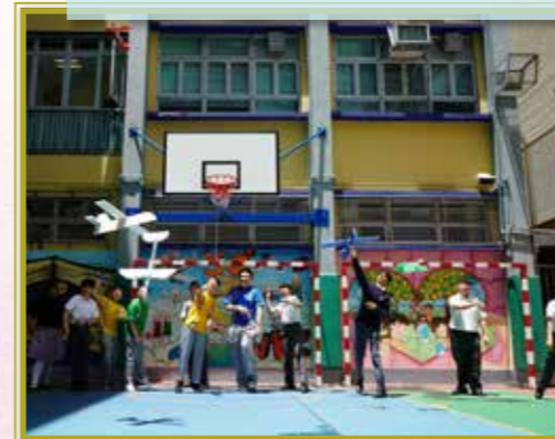
一起享受成功製作滑翔機的喜悅