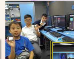
學生學習編寫智能手錶的程式

隨著網路與手機的普及，「物聯網 IoT」可創造個人與生活的無限可能。透過本課程，同學們可學習到物聯網的基礎知識，並應用於智慧家庭、智能城市、位置搜尋、遙控機械人等。學生又會學習編寫智能手錶的程式，收集和分析數據，於生活中實踐和應用 STEM 知識。