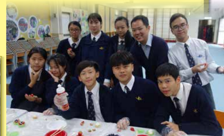
師生親手製作果撻