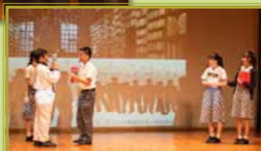
比賽以話劇形式進行，培養學生對 STEM 的興趣