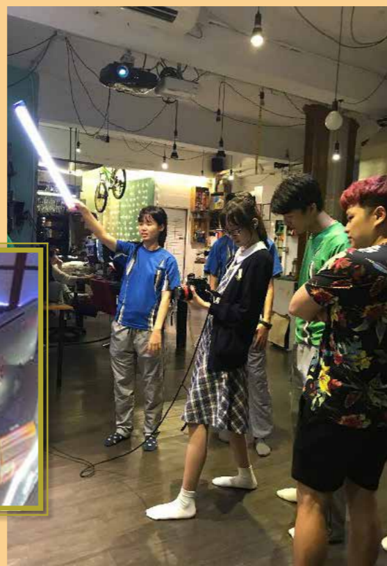
看我用鏡頭捕捉動人的時刻