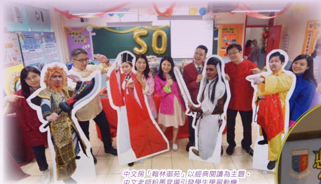
中文房「翰林御苑」以經典閱讀為主題， 中文老師粉墨登場引發學生學習動機