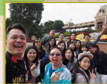
有幹勁，有創意，是我們的特質

The English week kept the essence of 'Guardians of the Galaxy' which helped to enthuse students to speak in English in a more relaxing and comfortable environment. An evidence to prove the success of this week was the blissful smile and enthusiastic participation of students.