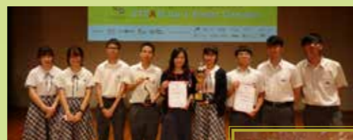
贏得「未來工程師計劃 2019 - STEAM UP A SMART CAMPUS」亞軍及最佳創新項目獎

未來工程師計劃 2019 以「智慧校園」為題，透過參觀、講座和比賽，介紹智慧城市的科技、綠色建築設計和創新工具的應用，促進不同學校學生之間的交流互動。比賽以話劇形式進行，讓學生們總結在此計劃中的所見所聞、所學所想。本校同學在比賽中表現出色，贏得「未來工程師計劃 2019 - STEAM UP A SMART CAMPUS」亞軍殊榮及最佳創新項目獎。