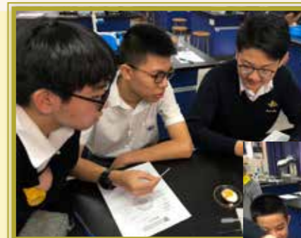
同學以雞蛋做實驗，深入認識身邊的食物