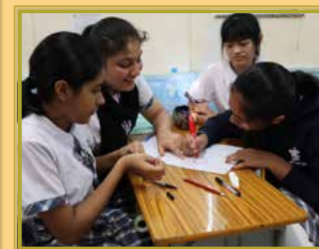
中三級同學有商有量，畫出愛心