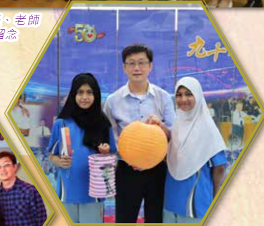
非華語學生與老師共慶中秋