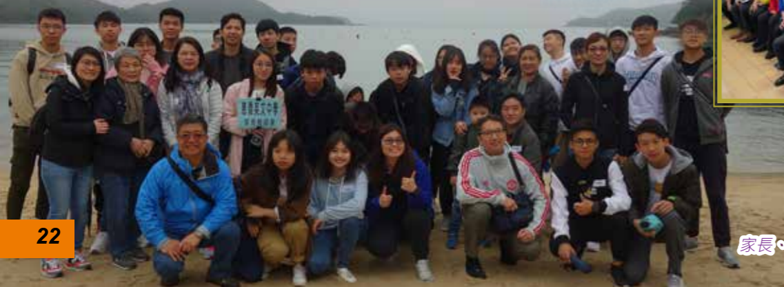
家長、老師、同學一家親！