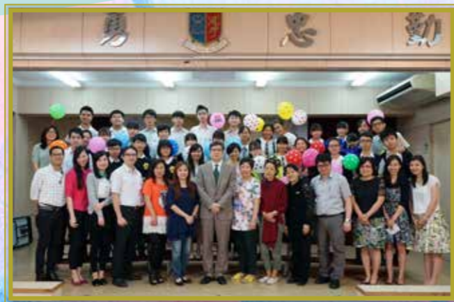
家長們也積極參與敬師活動呢！

家長教師會作為家校緊密聯繫的重要橋樑，每年積極籌辦多元化的活動，例如家長講座「伴你啟航」、「e-class 應用工作坊」等，讓家長掌握最新的教育資訊。此外，一年一度的親子旅行日讓人滿心期待。今年「親子郊遊樂」暢遊西貢鹽田梓、地質公園等保育景點，讓家長與師生在輕鬆的環境中互動，並對香港有更深入的认识。各家長委員更鼎力支持校園的各項活動，包括「生果日」、「歌唱比賽」、「年宵攤位」和「周年陸運會」等，是惠僑辦學的強大後盾。