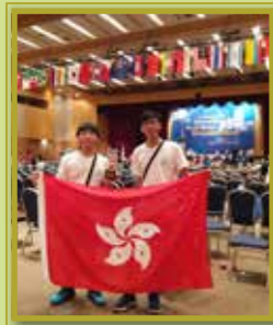
「國際青少年機械人比賽 2019-機械人避障賽」中，獲得銅獎殊榮。