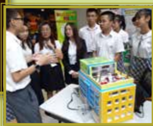
同學們悉心講解，展示學習成果