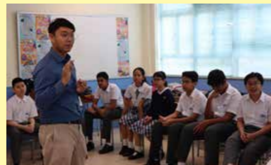
社工為大家講解遊戲規則

展望未來，我們期待與學生一同走過荊棘滿途又富有挑戰的一個學年，見證他們在蛻變中成長。