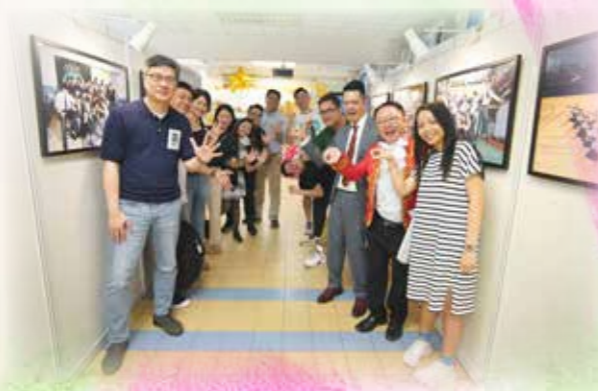
穿越時光隧道，往返五十周年