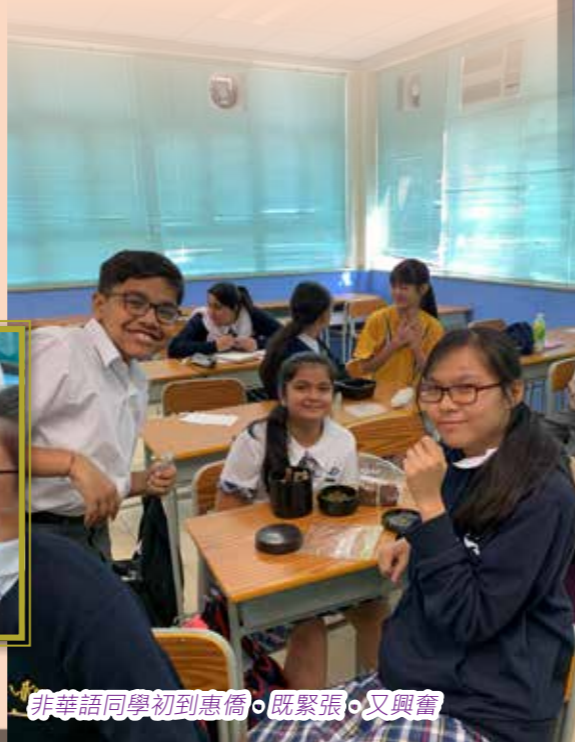
非華語同學初到惠僑，既緊張，又興奮