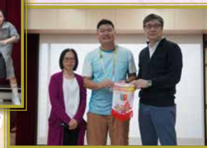
透過多元共融講座，締造多元和諧社會