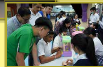
同學們全情投入贏取糖果，向老師表達心情！