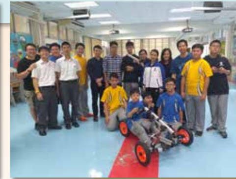
團隊透過合作成功組裝電動車