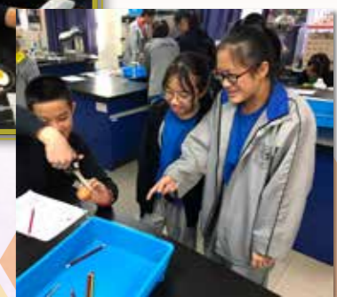
同學對蛋殼進行研究，探索雞蛋的秘密