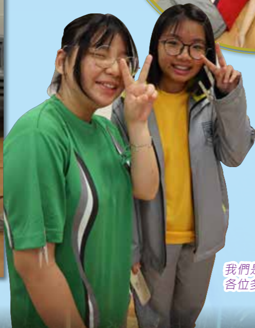
我們是新加入的領袖生，各位多多指教！