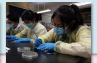
學生以細菌作畫，發揮藝術天賦