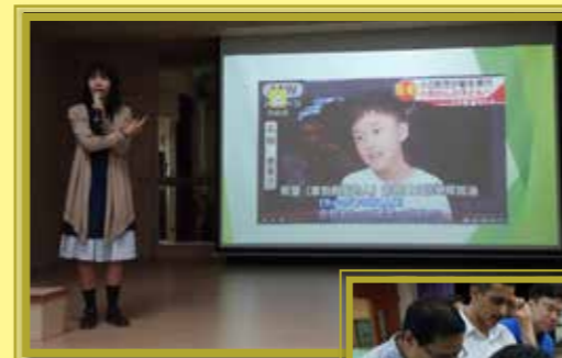
老師在晨光雋語的有趣分享發人深省

心情好，做事自然事半功倍。輔導組與香港青年協會、學校社工合辦的一系列活動及工作坊，提升學生對情緒健康的關注，並認識各種舒緩心情的方法，使學生在活動中學習如何時刻保持好心情。