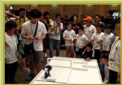
同學進行機械人避障賽

此外，於北京舉行的「世界機器人大會 (WRC) Dobot 智造大挑戰」中，本校學生亦與世界各地學生於比賽中一起切磋比拼，交流技術。