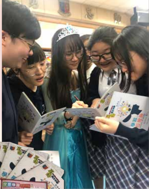
一起分享學習成果