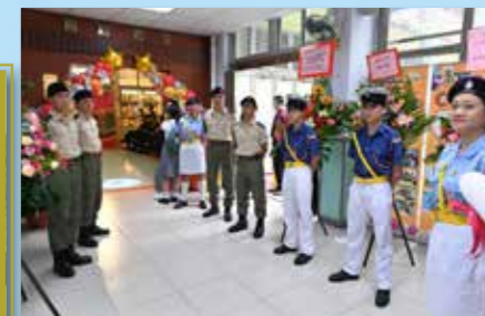
為學校不同的重要活動當值