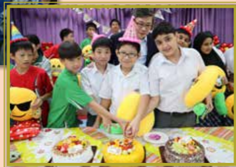
壽星們一起切生日蛋糕