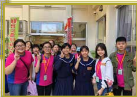
到訪沖繩校園和日本學生一起上課