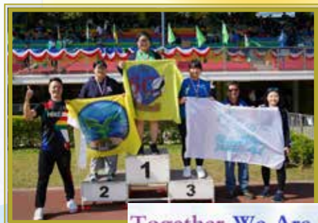
為班爭光的時刻，當然要揚起班旗與班主任拍照留念！