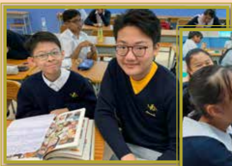
有疑難要向學長請教呢！

各級學長以小組形式輔導學弟妹，與昨日的「我」分享今天的事。通過午膳聚餐活動，學長與學弟妹分享校園生活體驗和學習心得，並解答中一新生們的各種疑難，讓學弟妹早日融入校園生活。學長們也能從中沉澱反思，有所進益。