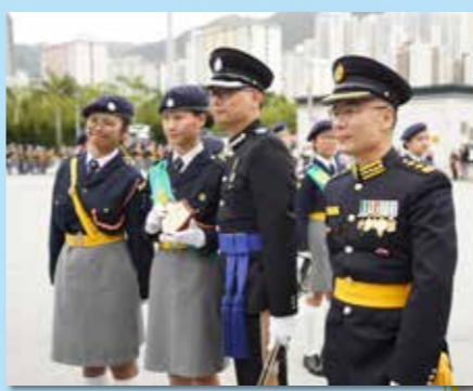
交通安全隊連續多年獲得西九龍分區步操比賽三甲

制服團隊有紀律的生活，已成了惠僑傳統。新生可以選擇加入香港少年領袖團、聖約翰救傷隊、童軍、香港交通安全隊或深資童軍，透過團隊訓練活動，如步操、急救及野外求生訓練等，發掘潛能，提升組織、領導、應變和創新能力。各團隊經常參與區內服務，多年來獲得不少政府部門及區內服務機構的讚揚，隊員所獲得的能力及經驗，能幫助他們日後的人生發展。制服團隊除了提升學生的抗逆能力，更能讓他們認識到一班與其同甘共苦的朋友，亦能夠讓學生和老師在課堂以外建立深厚的師生情誼。