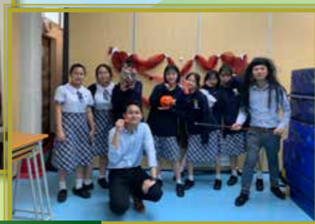
嘩鬼嚇得同學膽戰心驚！