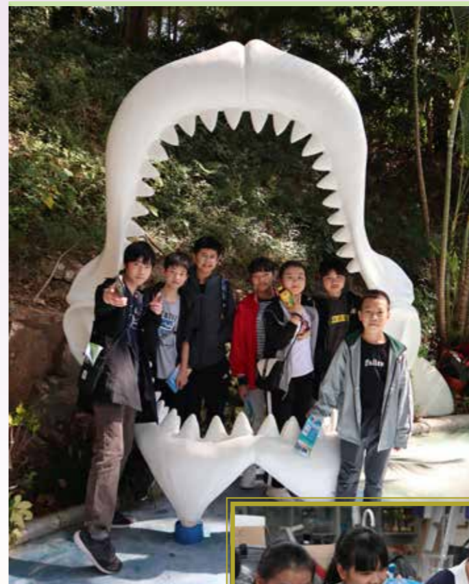
海洋公園一日遊加深了小夥伴們的感情