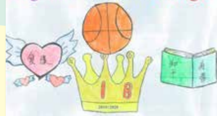
1B 班徽畫工雖稚嫩，但設計意涵豐富，還有句押韻的口號呢！