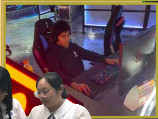
感受專業電競選手的裝備

「知己知彼，百戰不殆。」學校致力舉辦多元化的參觀和實習活動，讓學生盡早知悉不同行業的概況，為未來就業作好準備。參觀除了著重學生與講者的互動外，亦會安排體驗環節，讓學生能親身感受職場實況，啟發學生對擇業方向的規劃。