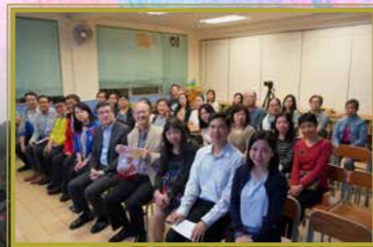
家長講座：做個通情達理的父母！