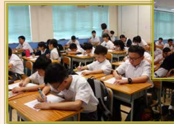
同學們認真參與，致力提升學習技巧

一如以往，本校為中一級學生舉辦學習技巧班優化學習技巧。課程內容包括閱讀技巧、確立目標、概念圖、時間管理及考試技巧等。當中撰寫筆記的技巧有助學生解決溫習上的困難，有趣的學習記憶法，則可幫助學生掌握學習竅門，強化學習的自信心，促進自主學習。