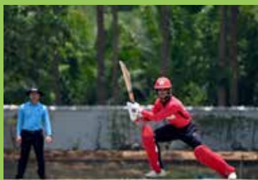
英姿颯颯的麥太沙同學

I am currently located in Hong Kong and have been conducting many trainings for tournaments to come. Despite circumstances, I will be trying my best and going all length in club matches and all endeavors. 'InshAllah' one day I will succeed!