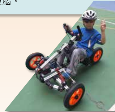
學生親自體驗電動車，樂在其中

惠僑同學們發揮創意和合作精神，師生們一步一步把電動車組裝起來。過程中，同學們能建立自信，學習到不同的機械原理及應用電腦編程，改良電動車的系統，並通過仔細觀察、測試與不斷創新，提升科學頭腦。