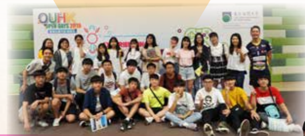
榮譽學生參觀大學學系

上學年年終，一百五十位表現優秀的學生浩浩蕩蕩往海洋公園和迪士尼樂園玩樂去。凡於本學年考獲全級首十名，或經老師遴選出來的「最佳進步學生」，均可參與「榮譽學生之旅」作獎勵，盡情放鬆身心，名副其實做到「Work Hard, Play Hard」。