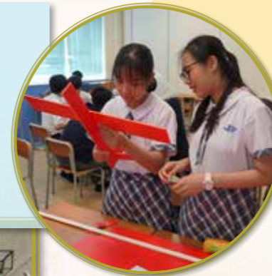
同學用心製作滑翔機

中一及中二級同學學習飛機飛行原理，親手設計及製作滑翔機。同學們發揮創意，反覆實驗，以達到飛行距離最遠的效果，寓學習於娛樂。