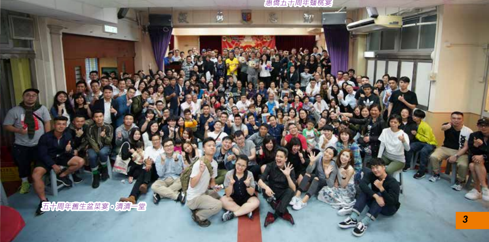
五十周年舊生盆菜宴，濟濟一堂