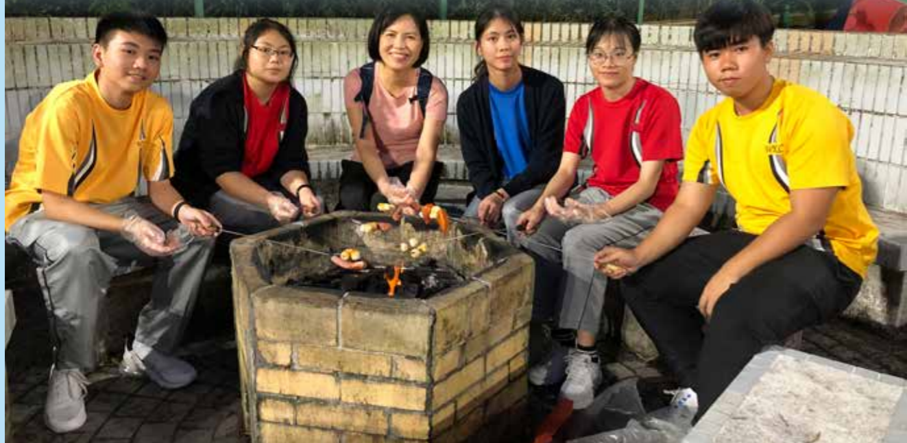
幾經辛苦，我們成功燃點爐火