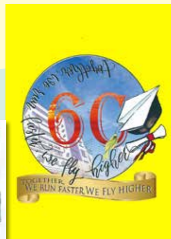
6C 班徽的口號別具意義，是對畢業班同學的期望和祝願