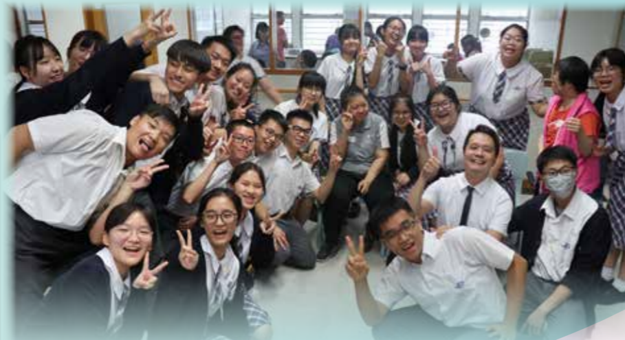
6C 與老友記共渡歡樂的下午