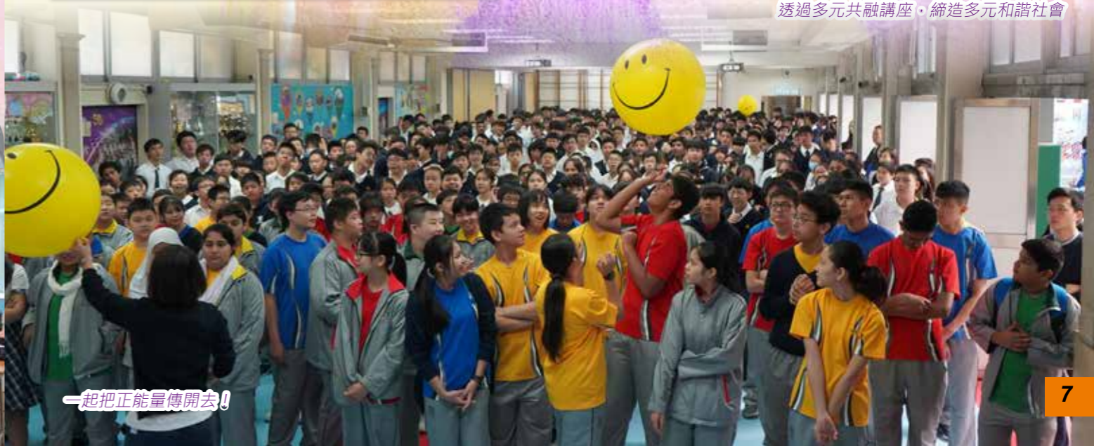
一起把正能量傳開去!