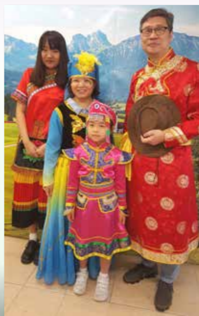
數學房中，老師悉心指導到訪的 小學生玩數學遊戲