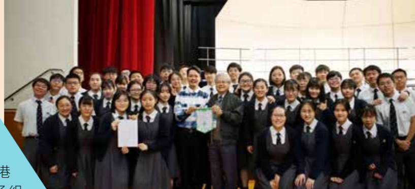
評判高度讚譽惠僑的表現，6C 人人喜上眉宇之間

惠僑 6C 班中文集誦隊出戰第 71 屆香港校際朗誦節，中五及中六級粵語詩詞男女子組集誦比賽，誦材為講述荊軻刺秦王的《易水行》，以及司馬遷對孔子表示高山仰止的《孔子世家》。群雄逐鹿，結果以一分之微擊敗國際音樂學院等多間名校勁旅，再度奪魁。連同過往三屆已畢業的師兄師姐所奪得的冠軍，惠僑已連續四年雄踞冠軍寶座。