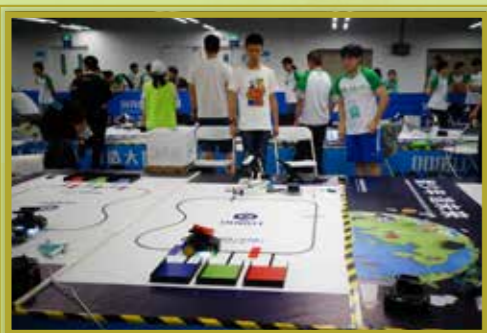
與世界各地學生交流，培養創新能力與國際視野