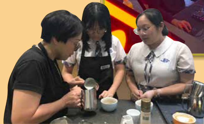
導師示範如何沖調一杯完美的咖啡