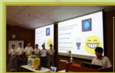
正在進行匯報的惠僑同學

本校參加了「青年科技專才展覽及比賽」(中學組)- Young Professionals Exhibition & Competition 2019 (YPEC2019)，參賽隊伍向參觀人士展示學習成果，透過多媒體工具、演講及展覽攤位來闡述意念。