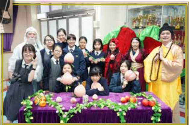
惠僑五十周年蟠桃宴