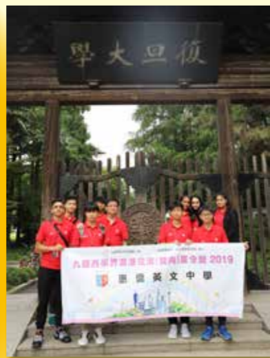
參觀世界知名的上海復旦大學，激發學習動力

惠僑學生在暑假放下學習的壓力，參加「九龍西學界滬港交流夏令營2019」，夜宿上海洋涇中學學生宿舍，體驗內地舍生生活，並與該校領袖生造訪上海復旦大學和交通大學，與大學師生進行學術交流；又參觀了多個著名地標及旅遊景點、夜遊黃埔江、在百樂門舞廳用膳。在旅程的最後一天，同學們寫下了「十年之約」，期盼十年後重返上海洋涇中學，親拆信箋，感受願望達成的喜悅。此趟遊學，不但開拓了眼界，還收穫了友誼，別具意義。