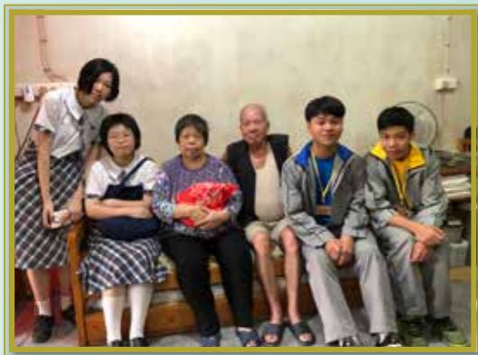
為獨居長者帶來暖意

每年，學校都悉心策劃別具意義的班際義工活動，期望同學體會「施比受更有福」的道理，例如探訪獨居老人，到訪長者中心和友愛之家，並送上小禮物及祝福。透過義工活動，讓學生更關心長者健康及生活，明白長幼共融對和諧社會的重要性。「贈人玫瑰，手有餘香」，同學完成義工活動後，親身感受到助人為快樂之本的真諦。