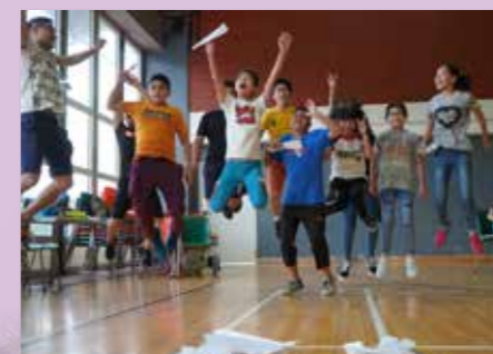
師生同心奮力向上

眾人拾柴火焰高！人與人之間的互助合作是成長必學一課。每年暑假舉辦的「中一迎新歷奇營」既是燃點新生熱情的開始，也是建立師生互助互信關係的起點。在老師和學長陪伴下，中一新生在營內經歷不同的歷奇活動，共同完成各種任務。營裡每個活動，既可幫助新生認識身邊的同學，也讓他們明白「惠僑一家」的精神，迎接未來六年的挑戰。