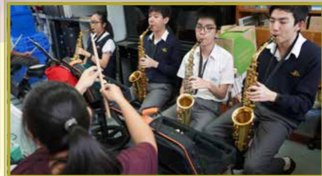
「惠僑 Kenny G.」色士風高手即將誕生