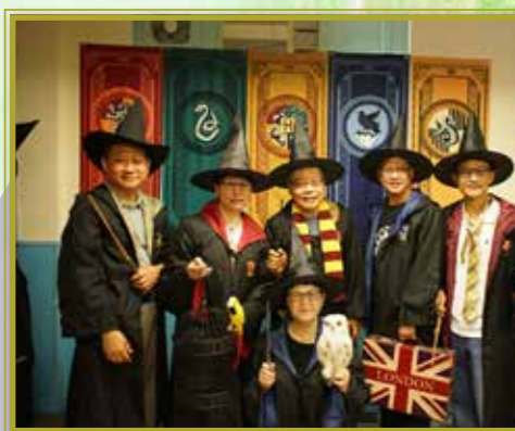
第一屆畢業生，在惠僑相識50載回母校， 友誼跨越半世紀