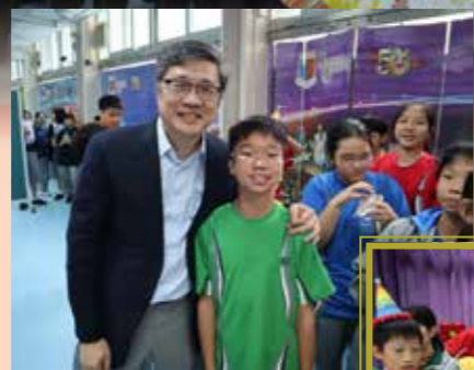
校長為生日之星送上祝賀，同學們笑逐顏開

你的生日，我們都記在心裡！惠僑輔導組及班級經營小組每三個月為中一學生舉辦一場別開生面的生日會。當天除準備了生日蛋糕外，校長、輔導老師、班主任及學長們都會到場為各壽星送上祝福及禮物，希望每位中一學生在生日會中都能感受到惠僑是一個溫暖、充滿愛的大家庭！