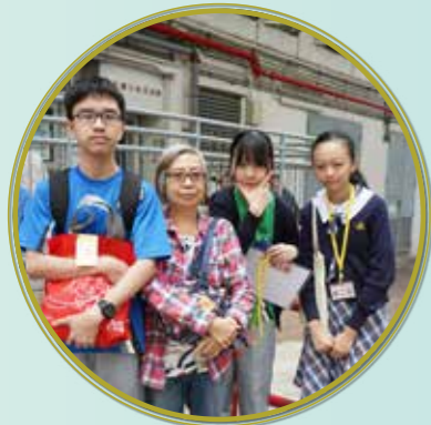
與長者義工進行探訪，體會長幼共融精神

每年，學校都悉心策劃別具意義的班際義工活動，期望同學體會「施比受更有福」的道理，例如探訪獨居老人，到訪長者中心和友愛之家，並送上小禮物及祝福。透過義工活動，讓學生更關心長者健康及生活，明白長幼共融對和諧社會的重要性。「贈人玫瑰，手有餘香」，同學完成義工活動後，親身感受到助人為快樂之本的真諦。