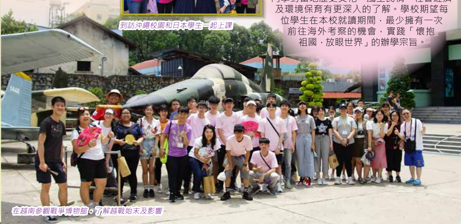
在越南參觀戰爭博物館，了解越戰始末及影響

讀萬卷書不如行萬里路。本校積極推行「世界學堂計劃」，每年均舉辦多次遊學團，帶領學生跳出課堂，前往不同的國家和城市考察，開拓眼界。去年，師生踏足東京、沖繩、新加坡、胡志明市、北京及上海，透過實地考察，以及與當地學生及市民交流，同學對當地歷史文化、風土民情、社會經濟及環境保育有更深入的了解。學校期望每位學生在本校就讀期間，最少擁有一次前往海外考察的機會，實踐「懷抱祖國，放眼世界」的辦學宗旨。