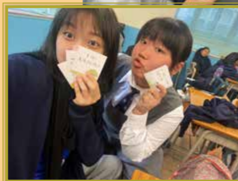
找到自己重視的價值觀，真開心！