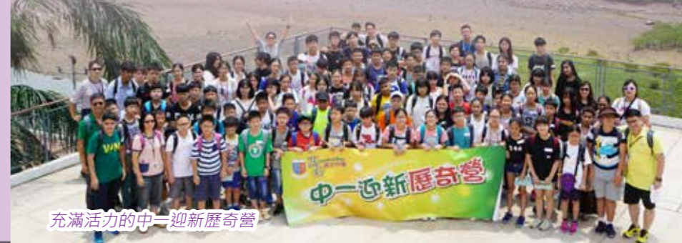
充滿活力的中一迎新歷奇營