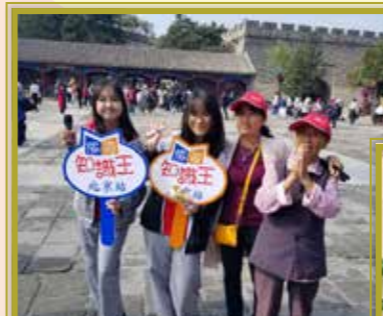
有幸獲邀到北京交流，與當地人接觸，深入了解當地文化