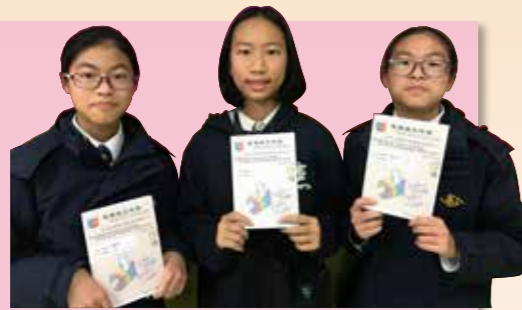
三位在11月份獲得金獎的同學

「三日不讀書，便覺語言無味，面目可憎」，當自己的腦袋空空如也時，真會自覺慚愧！本校的必讀書計劃得到各科的協作，挑選出「各科必讀書」供學生閱讀，並由老師帶領到圖書館借閱，務求讓同學多讀好書。透過本計劃，同學不但能拓闊閱讀層面，而且可以培養出適合自己的閱讀習慣。大部分同學都能達到全學年的閱讀目標，更有同學全年總閱讀量超過五十本，獲得金獎！