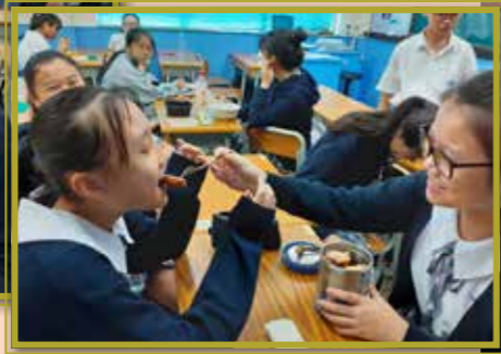
惠僑姊妹·情同手足