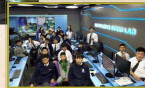
機械人學會會員在 STEM LAB 體驗編程的樂趣