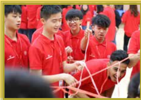
同學們全情投入集體活動