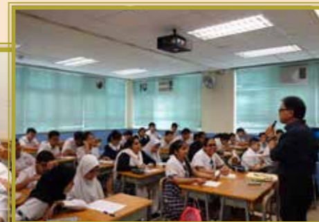
學習不同的記憶法，獲益良多