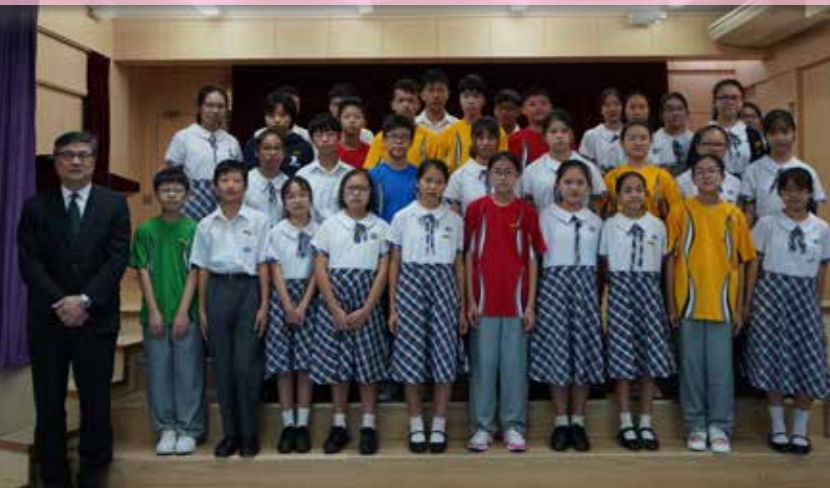
本年有30多位圖書館管理員兼閱讀大使

一眾閱讀大使肩負在校園推廣閱讀樂趣的使命，從學期初開始，由選書、組織活動以至錄影分享，都盡心盡力協助老師營造充滿閱讀氛圍的校園，培養惠僑同學愛閱讀、愛分享的習慣。各位閱讀大使更會參與坊間各類活動，如全港導讀比賽、閱讀嘉年華、到誠品書店及書展選書等，走出校園，增廣見聞。