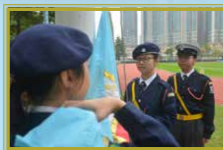
負責不同場合的升旗儀式

制服團隊有紀律的生活，已成了惠僑傳統。新生可以選擇加入香港少年領袖團、聖約翰救傷隊、童軍、香港交通安全隊或深資童軍，透過團隊訓練活動，如步操、急救及野外求生訓練等，發掘潛能，提升組織、領導、應變和創新能力。各團隊經常參與區內服務，多年來獲得不少政府部門及區內服務機構的讚揚，隊員所獲得的能力及經驗，能幫助他們日後的人生發展。制服團隊除了提升學生的抗逆能力，更能讓他們認識到一班與其同甘共苦的朋友，亦能夠讓學生和老師在課堂以外建立深厚的師生情誼。