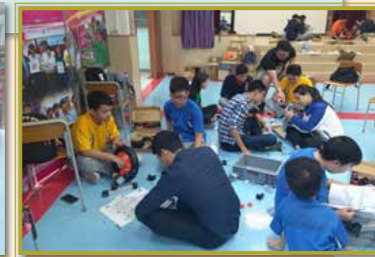
師生通力合作製作電動車