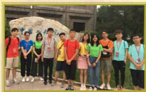
同學們抵達中國工程學院交流，增廣見聞

多位在科學範疇表現出色的惠僑同學，於去年暑假參加了由香港直資學校議會主辦的「高校科學營 2019」- 優秀高中生獎勵計劃，前往北京大學進行為期 7 天的體驗活動。活動理論與實踐兼備，學習與參觀並重，既有由專家主持的科學講座，又可以參觀科技場館、科研中心、高新技術園區、高校重點實驗室和創新實踐基地等。同學們更能體驗高校生活，與全國各地的優秀菁英學生深入交流，建立友誼。