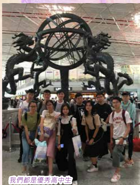
我們都是優秀高中生