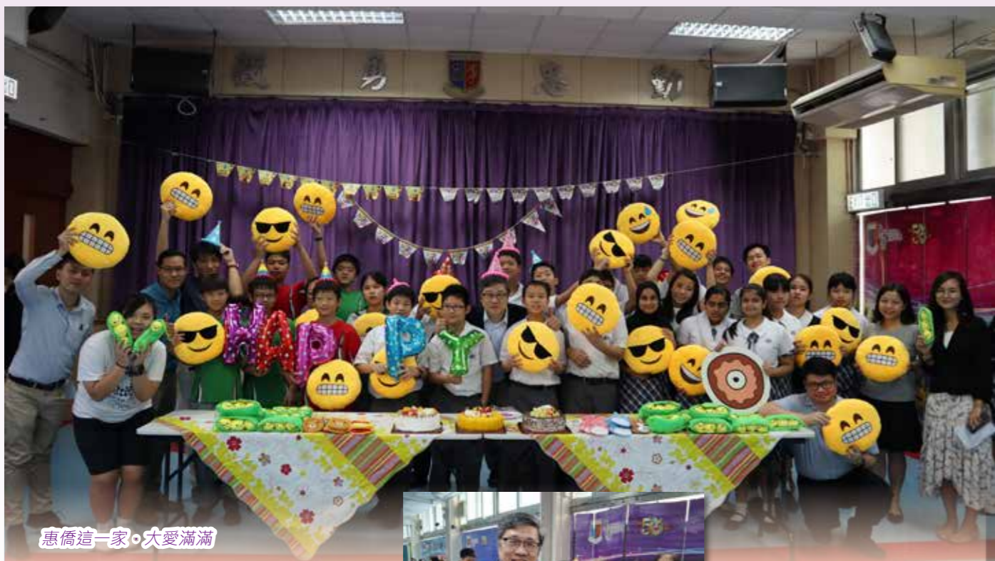
惠僑這一家·大愛滿滿