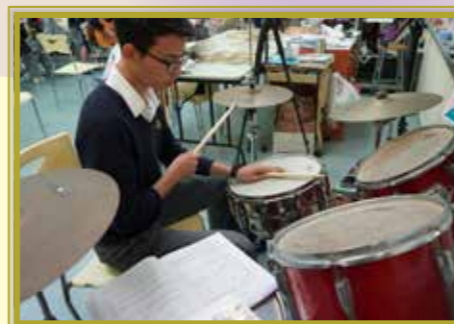
打鼓講求左右手協調，不容易啊！