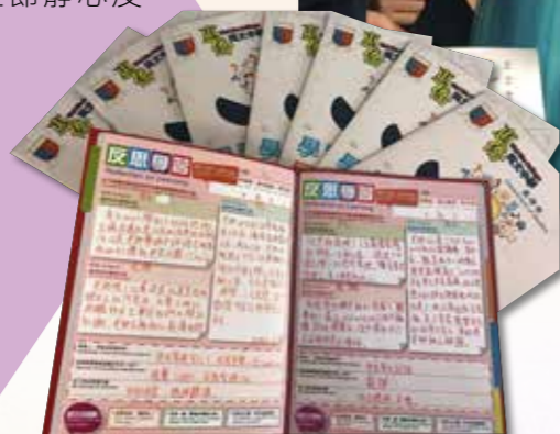
同學透過反思冊訂下測考目標及具體行動

子曰：「吾日三省吾身，為人謀而不忠乎？與朋友交而不信乎？傳不習乎？」《論語》一再強調反省有「傳而習乎」的重要性。教務組精心設計的《反思冊》，讓學生逢週五於班主任節靜心反省一周所學，記下其中兩科最深刻的學習內容；並且將最困難、最需要協助的學習問題寫下，讓班主任給予回饋及支援，成為師生間學術上的溝通橋樑。此外，測考前夕學生亦會透過《反思冊》訂下測考目標及達成的具體方法，然後以確切的行動實踐計劃。