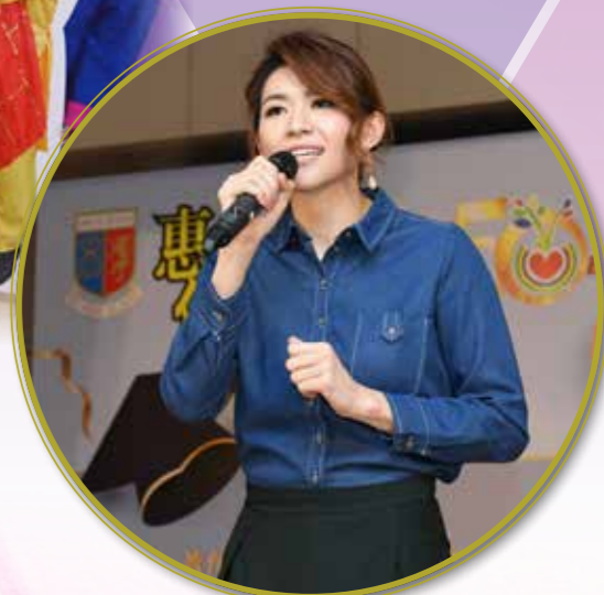
歌星校友陳凱彤高歌一曲，慶祝校慶