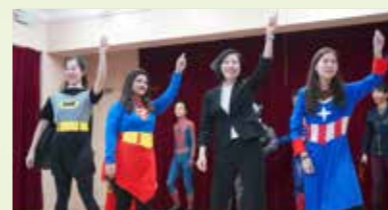
English Teachers Opening Performance

Wai Kiu College witnessed yet another marvelous English Week. The theme of English Week was 'Guardians of the Galaxy'. The English week offered a wide range of activities like Taste and Say, Tongue Twister, Reading Aloud. This year, two competitions were held, namely 'Spelling Bee' for the junior forms and 'Scrabble Competition' for the senior form.