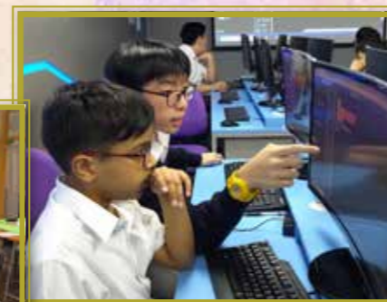
師兄協助教導初中生學習 STEM 機械人編程