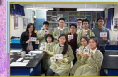
惠僑同學們的心血結晶

藉著菌繪活動，惠僑同學們打破了傳統的舊有思維，體驗將科學跟藝術融合的過程。同學們利用不斷生長、變幻莫測的細菌創作獨一無二的畫作，以菌繪將 STEM 與藝術結合，在學習科學的過程中不再局限於固有的理解框架，更能透過藝術創作表達自我，激發內在的創造力。