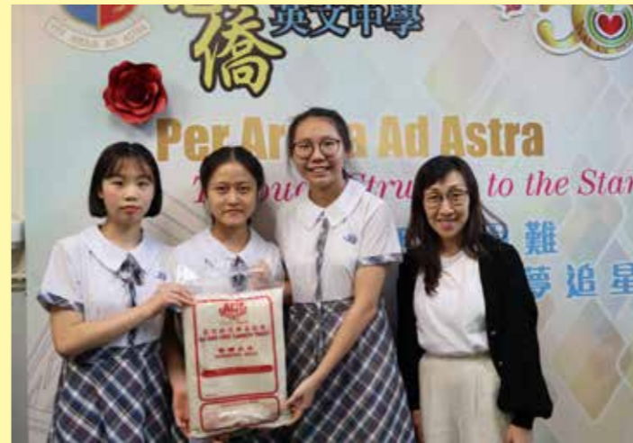
林姑娘帶領學生派米送暖

駐校社工的主要工作是為有需要的學生提供輔導，舉辦多元而適切的活動，讓學生健康成長。本學生始實行「一校兩社工」，學校社工有更多空間和時間密切關顧學生的身心健康。