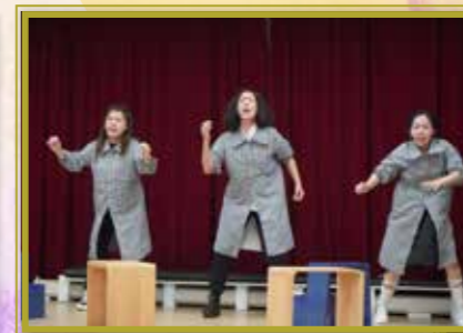
《懸崖邊上的人》互動禁毒教育劇

德育、公民及國民教育都是全人教育的重要元素，公民教育組為配合初中學生的成長需要，每月設有一節「德育公民課」，又舉辦不同主題的活動，例如：「《懸崖邊上的人》互動禁毒教育劇」、「選舉知多少」、「尊重互聯網上的知識產權」等，培育學生正面的價值觀，幫助他們健康成長。