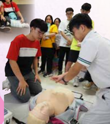
公開大學最受歡迎的護理學系

教務組安排本年度登上榮譽榜的同學們前往香港三間高等學府。一來暢遊校園，感受濃厚的學術文化；二來透過遊走不同學系，與現正就讀該系的學生交流，了解入學資訊。9月23日一行40位同學參觀了公開大學，活動後同學們能訂立更清晰的目標，部分更已鎖定心儀學系，未來一年奮發圓夢。