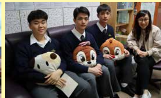
插班生初次聚會，說說在惠僑讀書的感受