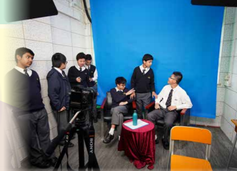
ACTION！小演員立即投入角色當中

惠僑提供種類多元的課外活動，旨在照顧不同的學習需要，激發興趣，推動自主學習。學習種類包括學術、興趣、體育及藝術等，涵蓋多個層面，讓學生可以按照興趣自由選擇，並在多元活動堂中認真學習，發揮潛能。本校更推行「一人一藝」計劃，所有中二同學必須參加一個藝術學會，如步操銀樂隊、舞蹈學會、戲劇學會、美術學會及校園電視台。透過藝術教育培養學生美感、提升個人品味及內涵，以正面的價值觀和積極的態度面對人生，有助學生確立人生目標和方向。