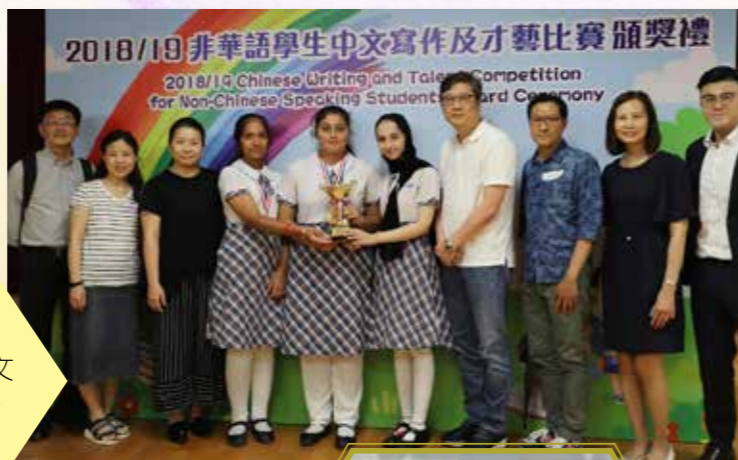
得獎學生與校長、老師及頒獎嘉賓合照留念

惠僑除按照非華語學生的中文水平提供不同程度的課程，幫助他們學好中文，準備公開考試外，一直積極鼓勵非華語學生參加各類型的中文比賽及活動，從而培養他們學習中文的興趣，增加學習的自信心。近年卓有成效，在校外舉辦的非華語中文比賽中屢創佳績，贏得三甲獎項，在 2018/19 年度舉行的「全港非華語學生中文講故事比賽」中，勇奪初中組冠軍及季軍。非華語學生也積極參與校內的學習日、中文週、中秋燈謎會及中文書法比賽等活動，師生同樂，體現惠僑共融的關愛精神。