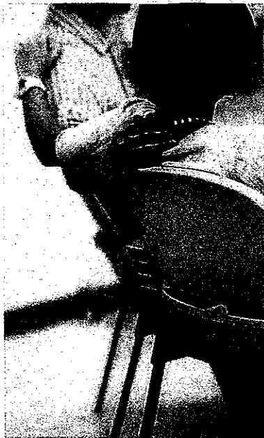
媽媽離去後，Summer每次思念媽媽，爸爸教她寫信抒發哀憫情緒。去年Summer便寫這封信，把思念寄給天堂裏的媽媽。