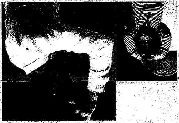
言語治療師鼓勵父母與小孩子多玩耍，透過遊戲，孩子最易學懂用